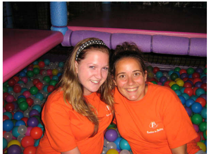
Popsicle and Pumkin, the day camp monitors.