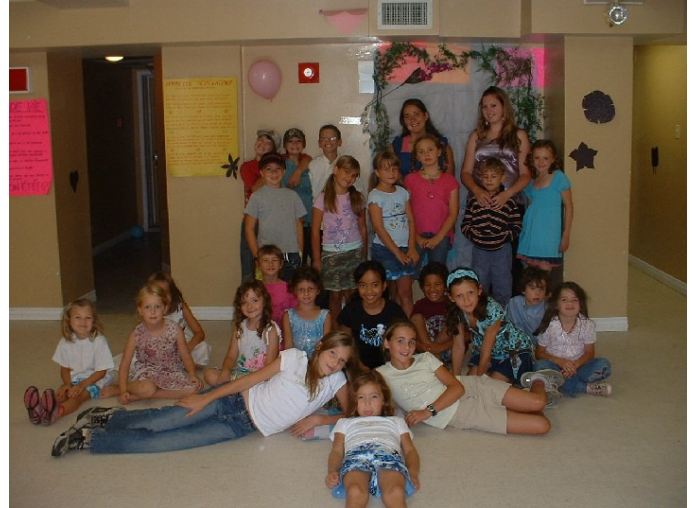
Some of our day camp participants

Marie-Pier Bisson-Côté Recreational development agent